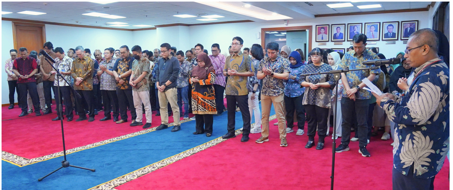
Direktur Utama Sarana Jaya memberikan sambutan dan melaksanakan do'a bersama menyambut tahun baru 2025.