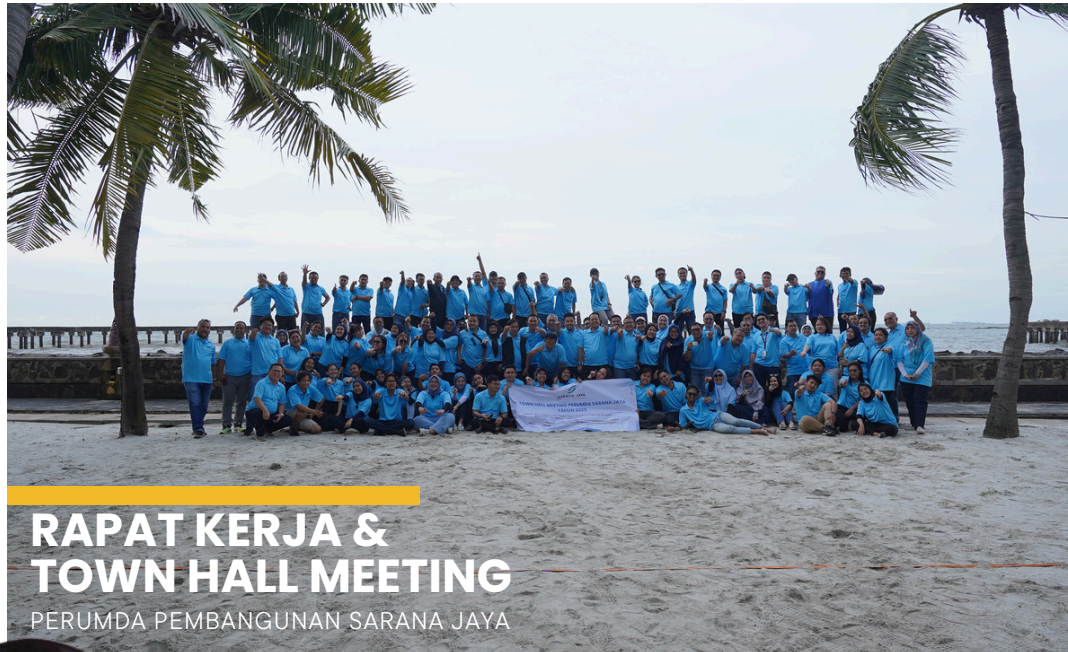
RAPAT KERJA & TOWN HALL MEETING PERUMDA PEMBANGUNAN SARANA JAYA