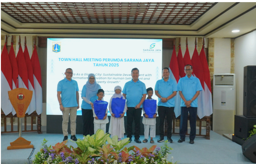
Pemberian santunan kepada anak yatim piatu sebagai wujud rasa syukur atas capaian yang di raih oleh Sarana Jaya.

Acara ini memperkenalkan Sistem Asset Management Security: Revenue and Cost Basis, inovasi berbasis teknologi yang meningkatkan nilai aset dan memungkinkan pengelolaan properti real-time. Sistem ini telah tersertifikasi BSN dan menjadi yang pertama diterapkan oleh BUMD di Indonesia.