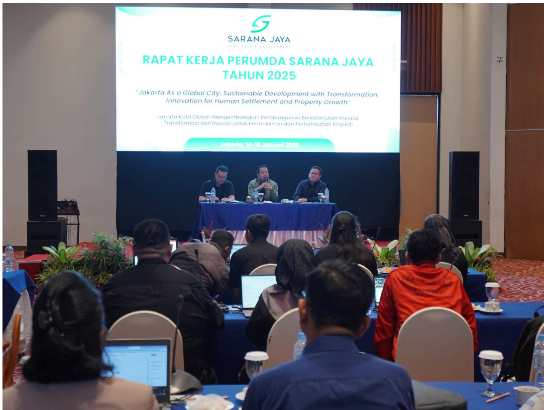
Jajaran Direksi Sarana Jaya tengah memberikan arahan pada kegiatan Raker Perumda Sarana Jaya 2025