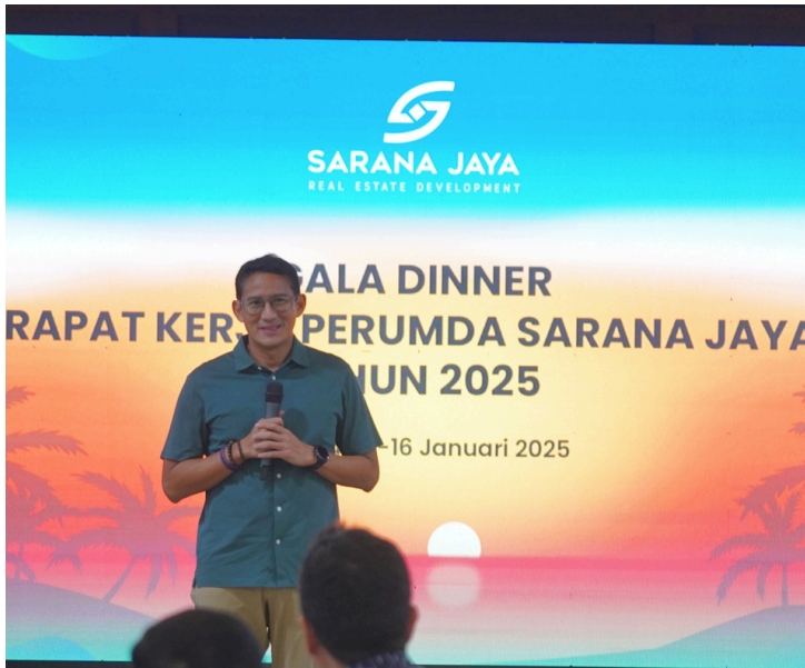
Bapak Sandiaga Uno memberikan arahan dan motivasi pada Gala Dinner RAKER 2025